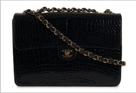
CHANEL SAC "Timeless" en alligator noir Vendu 12 129 €