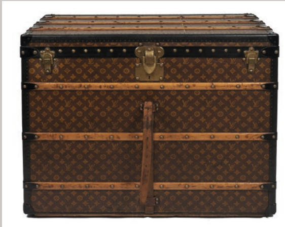
LOUIS VUITTON, circa 1910 MALLE "Haute" en toile Monogram au pochoir Vendu 9 100 €