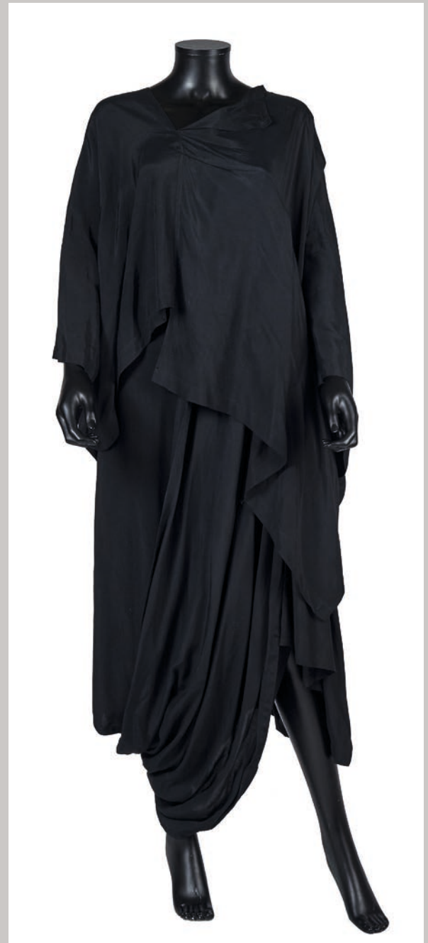
COMME DES GARÇONS (printemps-été 1983) ROBE-SAROUEL déstructurée asymétrique drapée Vendu 11 050 €

Contact: Pénélope Blanckaert +33 (0)1 42 99 20 15 pblanckaert@artcurial.com